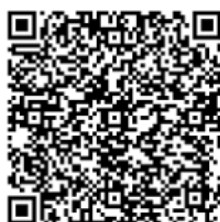
Piano dei corsi pistola